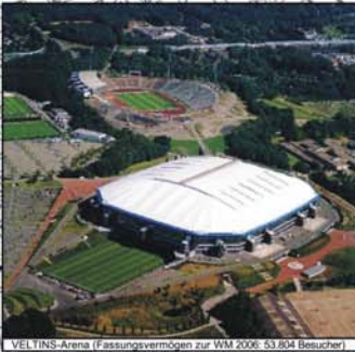
VELTINS-Arena (Fassungsvermögen zur WM 2006: 53.804 Besucher)